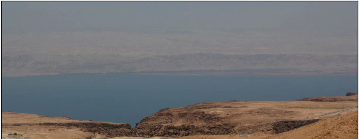
Panorama sur la mer Morte

La mer Morte est l'un des sites les plus étranges au monde : cette immense faille d'environ 80 km de long sur 15 km de large, située plus de 400 au-dessous du niveau de la mer, retient des eaux six fois plus salées que l'océan. Il règne à ses abords une atmosphère étouffante. Au fur et à mesure que l'on descend du plateau jordanien central vers la vallée du Rift, l'air devient lourd et humide. Soudain, contrastant avec les couleurs brûlées du paysage, apparaît ce lac immense, d'un bleu extraordinaire.