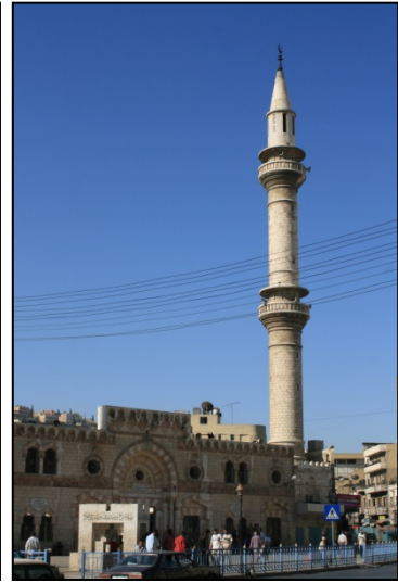
Mosquée du roi Hussein