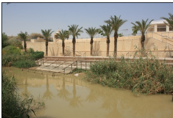
Site du baptême de Jésus