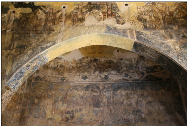
Fresque du Qusayr Amra