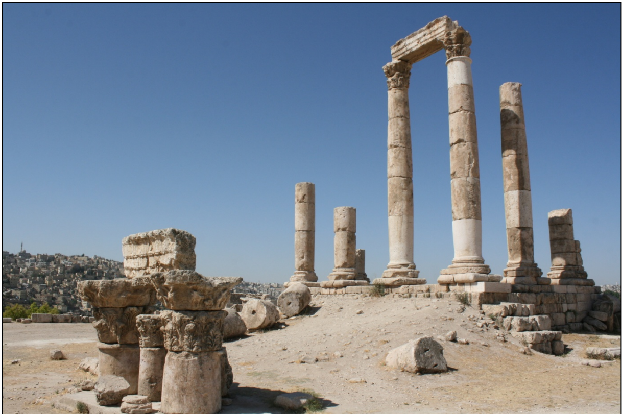
Temple romain d'Hercule

Vestige le plus impressionnant de l'ancienne Philadelphie, le théâtre romain a été construit au 2 ème siècle à la base d'une colline qui servait autrefois de nécropole. Il s'étend sur trois niveaux qui étaient chacun réservés à une classe de la population.