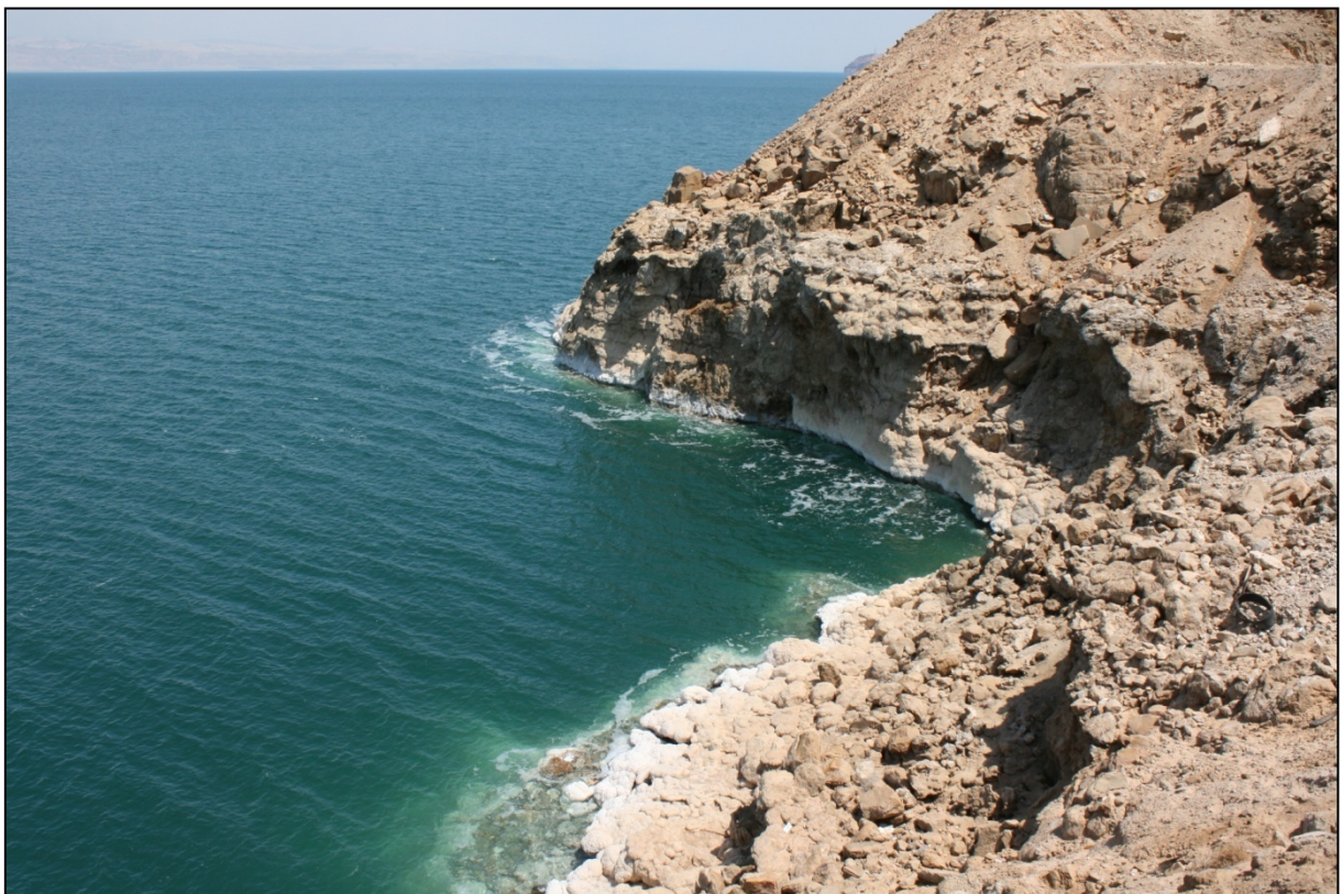
Versant salé de la mer Morte