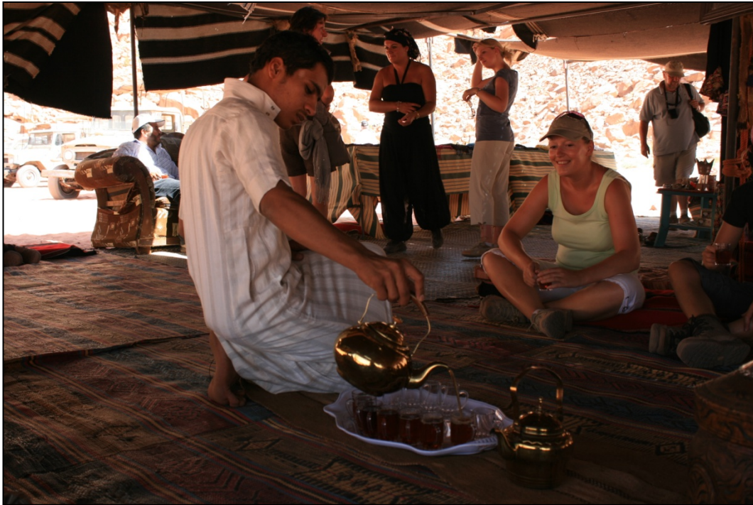
Pause thé sous une tente bédouine

Le Wadi Rum est une expérience à vivre. Visiter le Wadi Rum, c'est aller à la rencontre de la culture bédouine, qu'il s'agisse de bivouaquer autour d'un feu de camp, d'escalader des falaises de grès avec un guide local ou de boire le thé sous une tente en poil de chèvre.