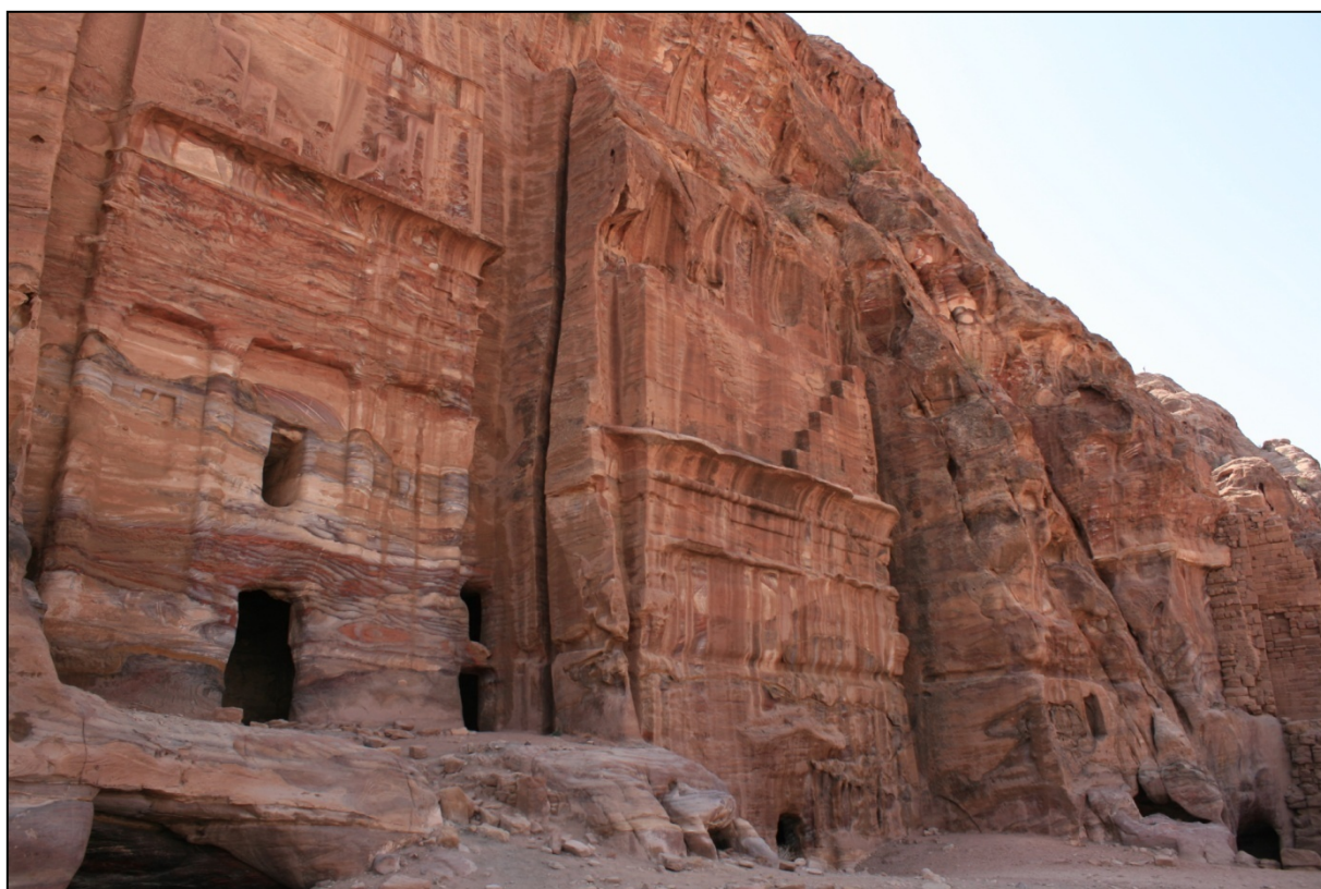
Tombes royales qui dominent la ville basse