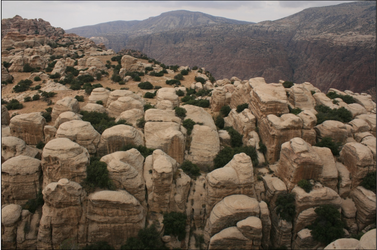
Falaises de grès de la réserve de Dana

Falaises de grès, sommets culminant à plus de 1500 mètres,... Dana est la plus vaste réserve de Jordanie. La vallée et ses escarpements de roche rouge protègent un écosystème d'une diversité surprenante. : 600 espèces de végétaux (agrumes, arbustes du désert, acacias,...), 180 espèces d'oiseaux et 45 espèces de mammifères (oryx, chat des sables, le renard commun et le loup,...).