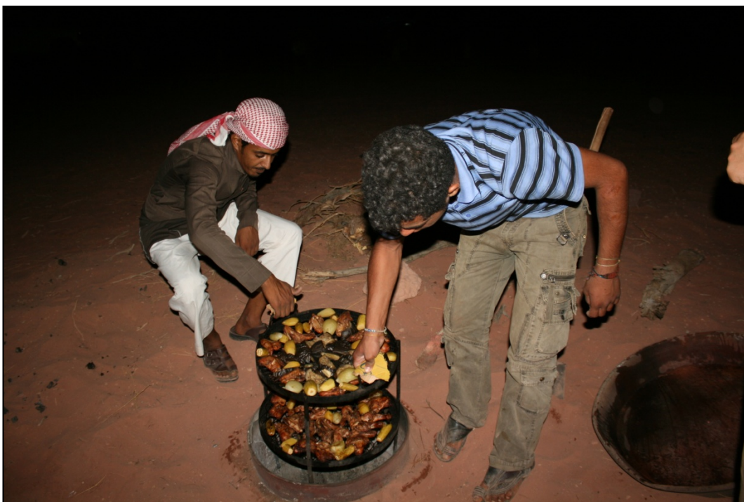
Grillades bédouines dans un campement