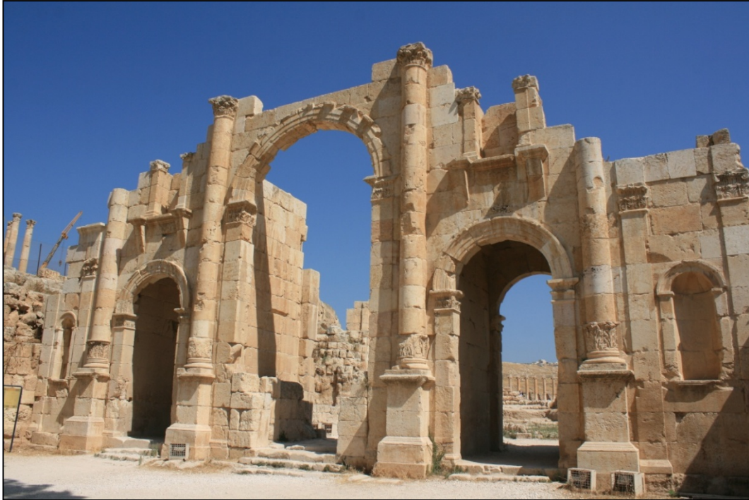
Arc d'Adrien (arc de Triomphe)

Ville de près de 20000 habitants, ces derniers tiraient profit des terres fertiles alentour. L'ancienne cité représentait le centre administratif, commercial, culturel et religieux alors que les habitants vivaient à l'extérieur. Les deux parties de la ville étaient reliées par des routes et des voies processionnelles.