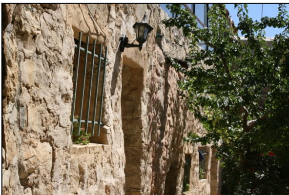
Habitation en pierre de Dana