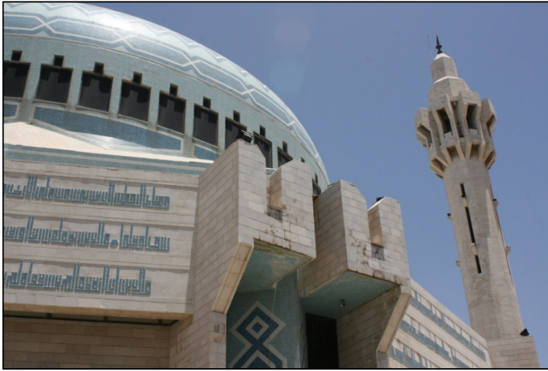
Mosquée du roi Abdallah