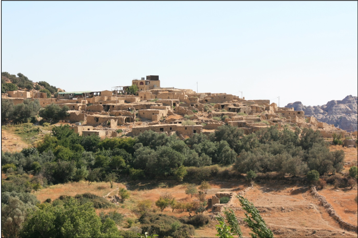
Village de Dana

Non loin de la route du Roi et à l'entrée de la réserve se tient le charmant petit village de Dana. Ce village de pierre du 15 ème siècle accroché à un précipice donnant sur la vallée, offre un somptueux panorama.