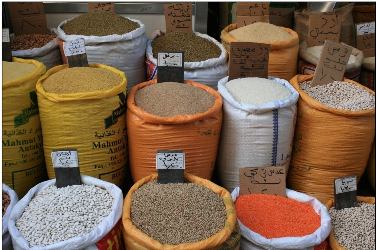
Epices et fruits-secs jordaniens au marché d'Amman

Amman c'est avant tout un éveil des sens et une découverte culinaire. Flâner dans le marché alimentaire avant de déguster une sucrerie dans les nombreuses boulangeries et terminer avec un plateau où le pois-chiche est décliné de nombreuses façons traditionnels (houmous, falafel,...) est une cativité à part entière.