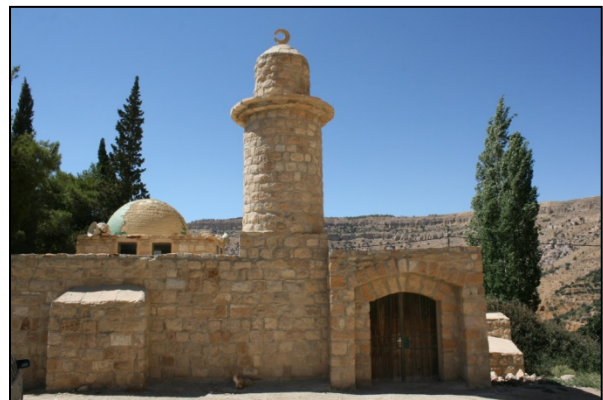
Mosquée de Dana