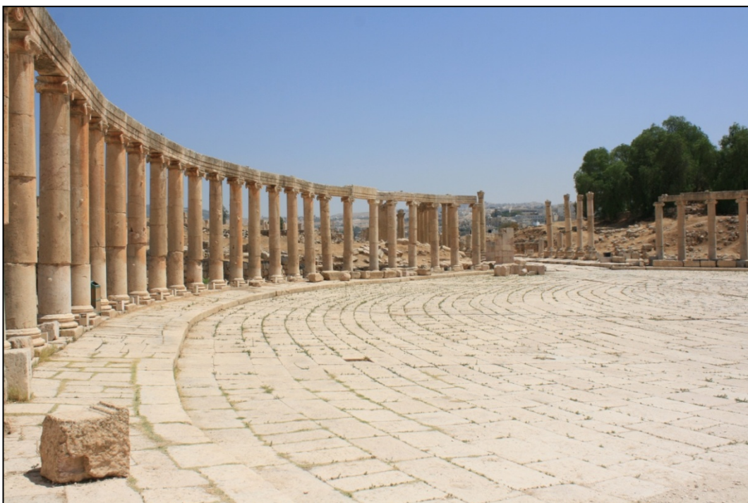
Place ovale (forum)