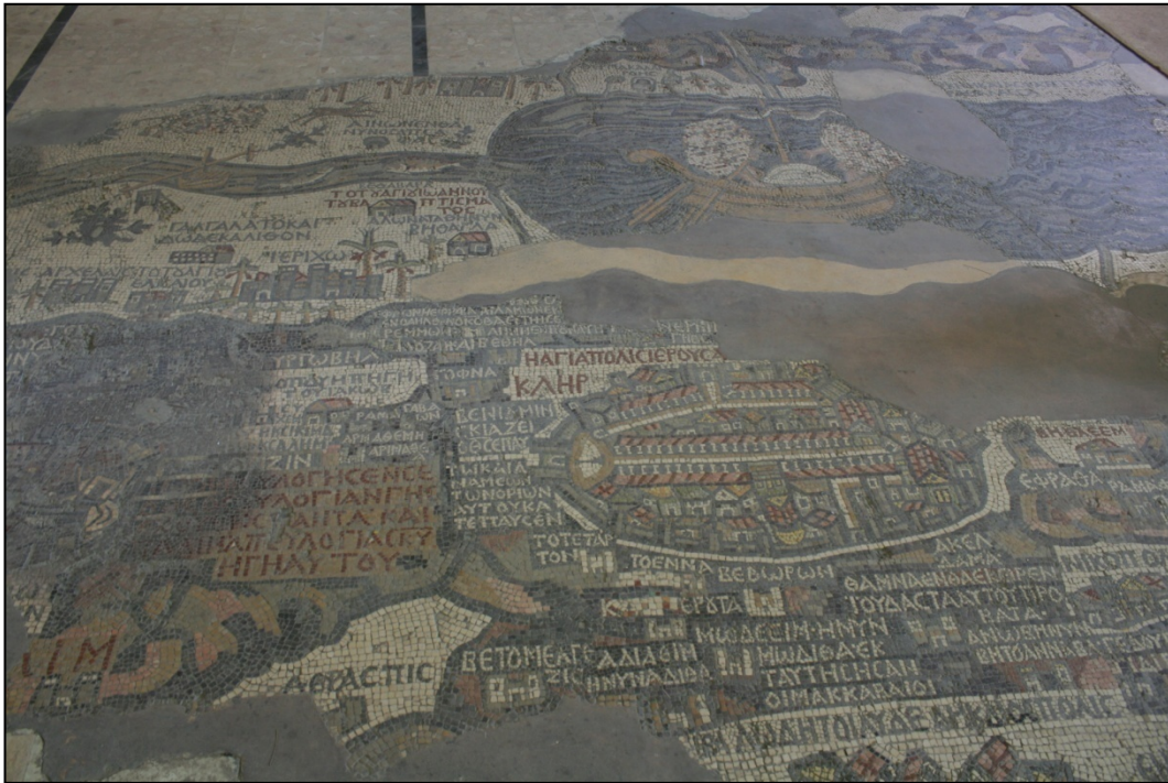
Carte en mosaïque des sites bibliques du Moyen-Orient dans l'église Saint-Georges

L'attraction principale de la ville est l'église Saint-Georges dont le sol est recouvert d'une carte en mosaïque localisant tous les grands sites bibliques du Moyen-Orient. Cette carte difficile à appréhender est accompagnée d'une légende de 157 éléments en grec.