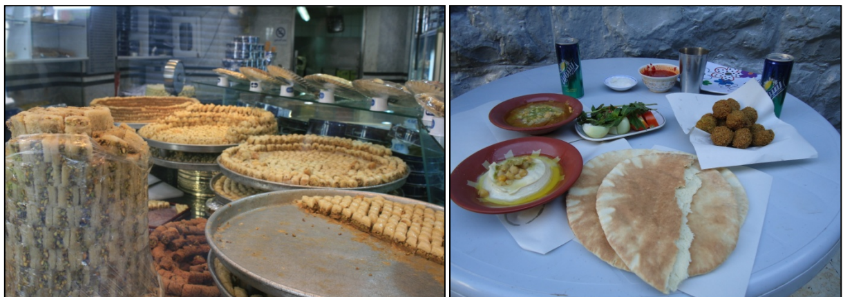
Délices sucrés d'Amman