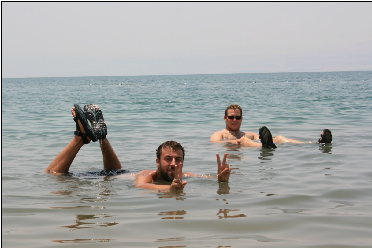
Flottaisons dans la mer Morte