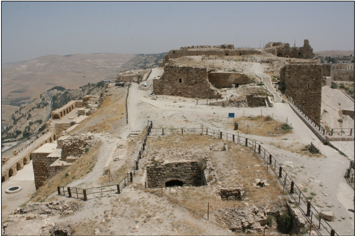
Forteresse de Kerak

Cette ville légendaire, développée autour de sa forteresse, offre plusieurs panoramas spectaculaires. C'est l'un des joyaux jordaniens. Cette forteresse a vu se succéder les batailles entre les croisés (les francs) et les armées islamiques de Saladin. A l'époque, le célèbre château n'était qu'une longue ligne fortifiée bâtie par les croisés, qui s'étendait d'Aquaba, au sud, jusqu'à la Turquie, au nord.