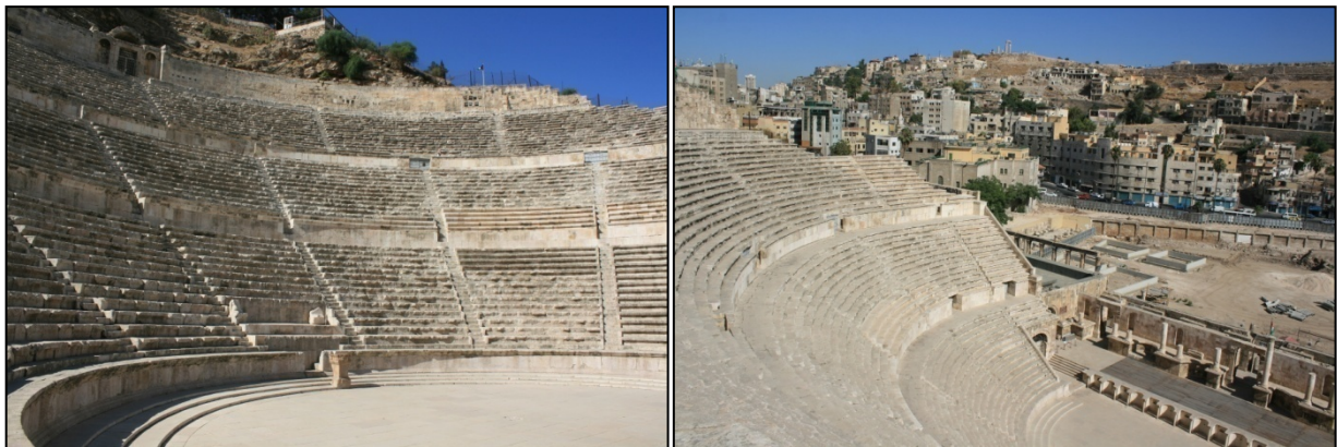
Théâtre romain d'Amman

Vestige le plus impressionnant de l'ancienne Philadelphie, le théâtre romain a été construit au 2 ème siècle à la base d'une colline qui servait autrefois de nécropole. Il s'étend sur trois niveaux qui étaient chacun réservés à une classe de la population.