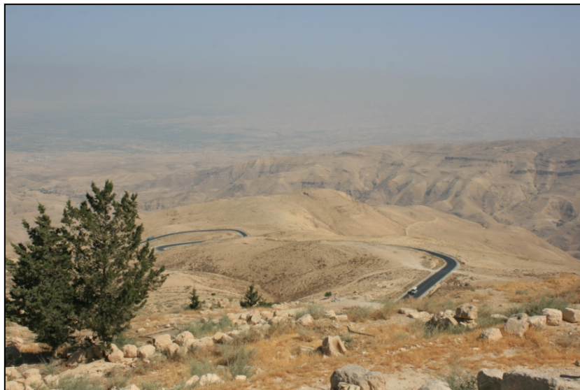
Sommet du mont Nébo