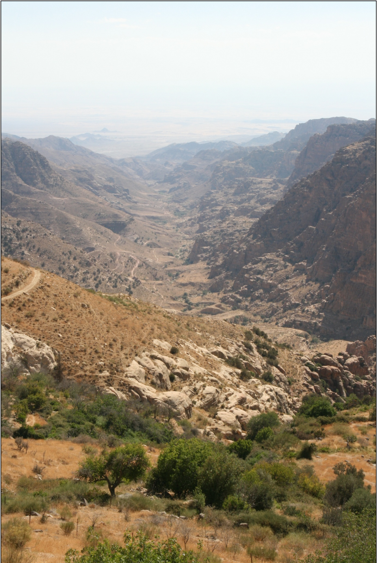
Panorama sur la vallée de Dana