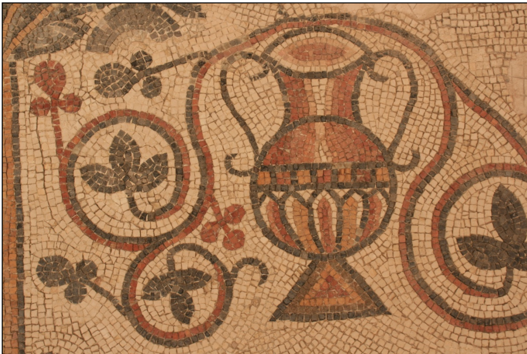
Mosaïque de Madaba